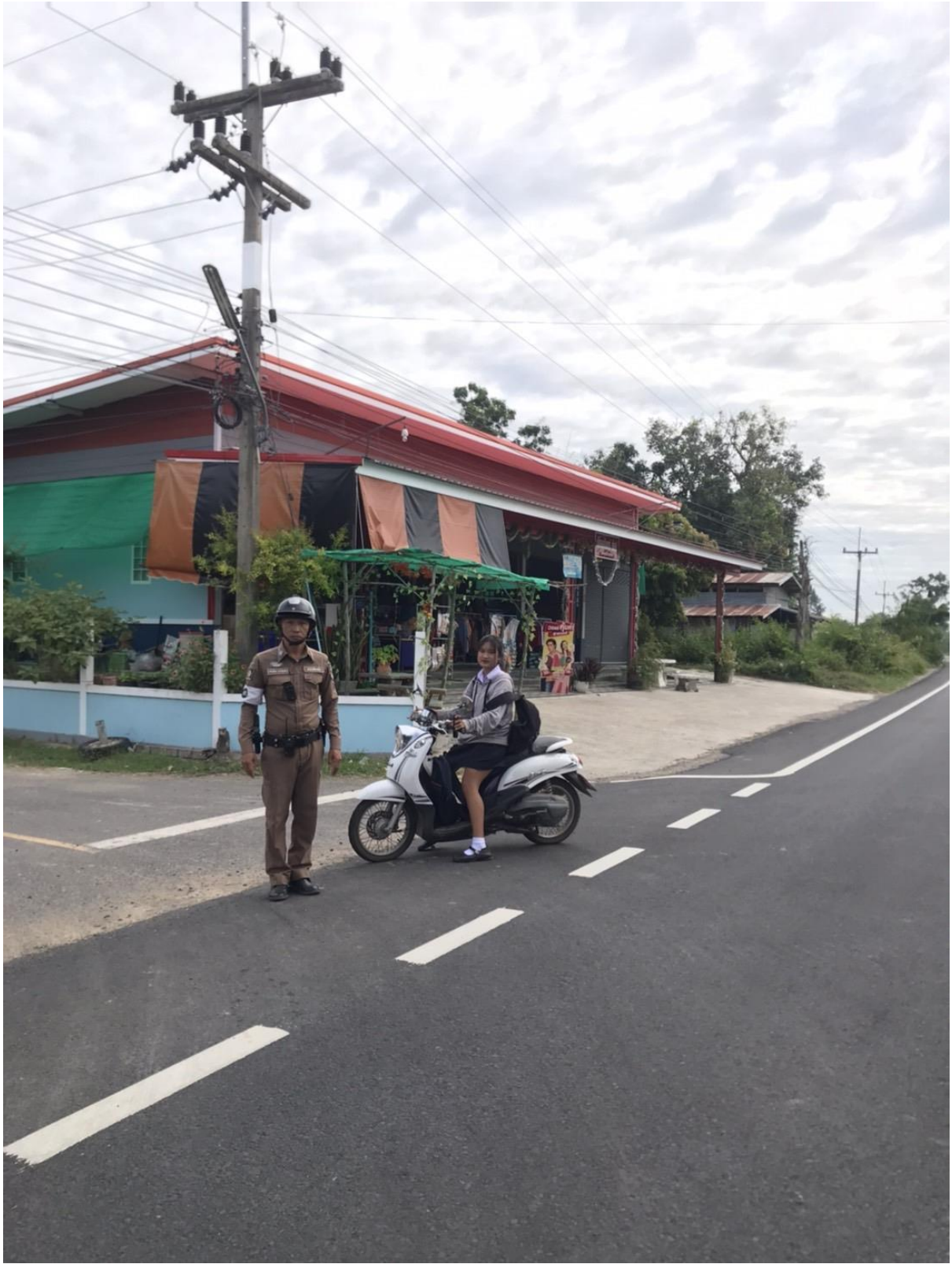
ตั้งจุดตรวจกวดขันวินัยจราจรตามมาตรการป้องกันและลดอุบัติเหตุทางถนนและป้องกันอาชญากรรม